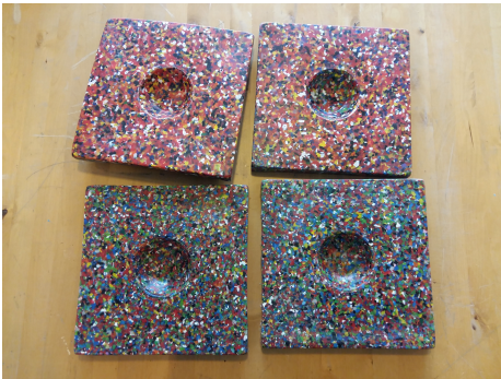
Knikkertegels na sparen!