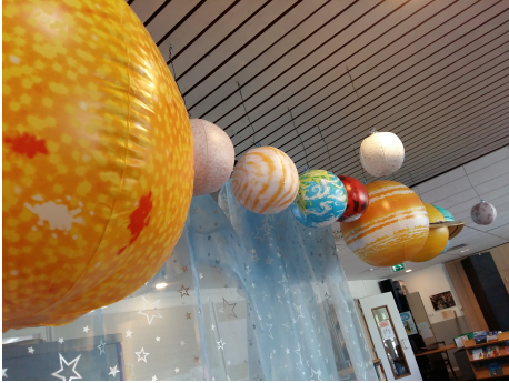
Thema Leskracht: planeten

Om de foto's nog beter te kunnen zien, kunt u de pdf inzoomen.