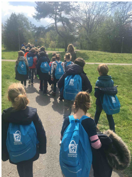
De leerlingen van de KMS wandelden het fantastische bedrag van EUR 10.465,00 bij elkaar!